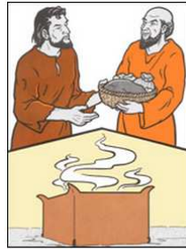
Epaphroditus brings offering to Paul, altar

దేవుని నుండి కృపను పొందుకొనుటకు మనము బలులు అర్పించనవసరంలేదు. క్రీస్తు చేసిన పాప పరిహారం ఇప్పటికే మనకు ఉన్నది, అది ఇంకా ప్రవహిస్తూనే ఉన్నది. దేవుని ప్రజలుగా మనం దానికి విలువగట్టుచూ ఎల్లప్పుడు కృతజ్ఞత అను బలిని సమర్పిస్తూ ఉండాలి. దేవునికి ఒప్పుదలను మరియు సంతోషం కలిగించిన క్రీస్తు యొక్క బలియాగం ద్వారా మనమందరం అశీర్వాదింపబడినట్లుగా మనంకూడా మన అనుదిన బలులద్వారా దేవునికి ఒప్పుదలను మరియు సంతోషాన్ని కలిగిస్తూ ఉండాలి కారణంఇప్పటికే క్రీస్తు ఆవిధంగా చేసియున్నాడు. ఫిలిప్పీయులు తన పనికి చేస్తున్న సహాయం దేవుని కిష్టమైన బలియాగం లాంటిదని పౌలు ఫిలిప్పీయులకు వ్రాస్తున్నాడు. “నాకు సమస్తము సమ్మద్ధిగా కలిగియున్నది. మీరుపంపిన వస్తువులు ఎవప్రోదీతువలన వుచ్చుకొని యేమియు తక్కువలేక యున్నాను, అవి మనోహరమైన సువాసనయు, దేవునికి ప్రీతికరమును ఇష్టమును యాగమునై యున్నవి.” ఫిలిప్పీ 4:18. ఫిలిప్పీయులు వారి పట్టణ పరిధులు దాటి పౌలు భక్తుని సేవకు తోడ్పాటును అందిచారు. అదేవిధంగా మనం కూడా కేవలం మన స్థానిక ప్రాంత సేవ కొరకు మాత్రమే కాకుండా ఇతర ప్రాంతాలకు సేవ విస్తరించులాగు నమన మద్దతును, తోడ్పాటును అందించాలి. కనుక మనలను మనం త్యాగం చేసుకొని ఇతరులకు సువార్త అందించు కార్యక్రమంలో మనం తోడ్పాటు అందించడమే క్రీస్తు మనకొరకు చేసిన బలియాగం యొక్క ముఖ్య ఉద్దేశ్యం.