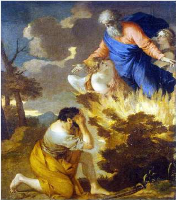
Moses and the burning bush