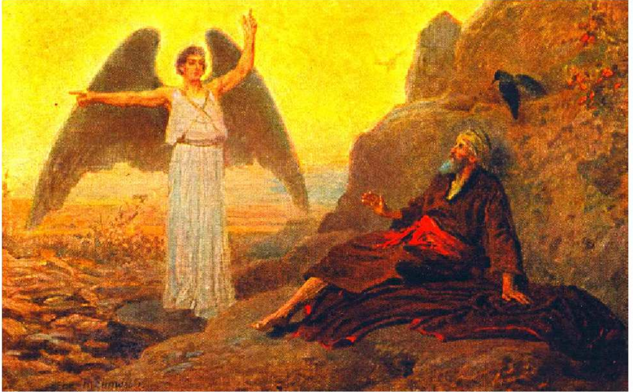
ELIJAH GIVEN DIRECTION BY THE ANGEL OF THE LORD