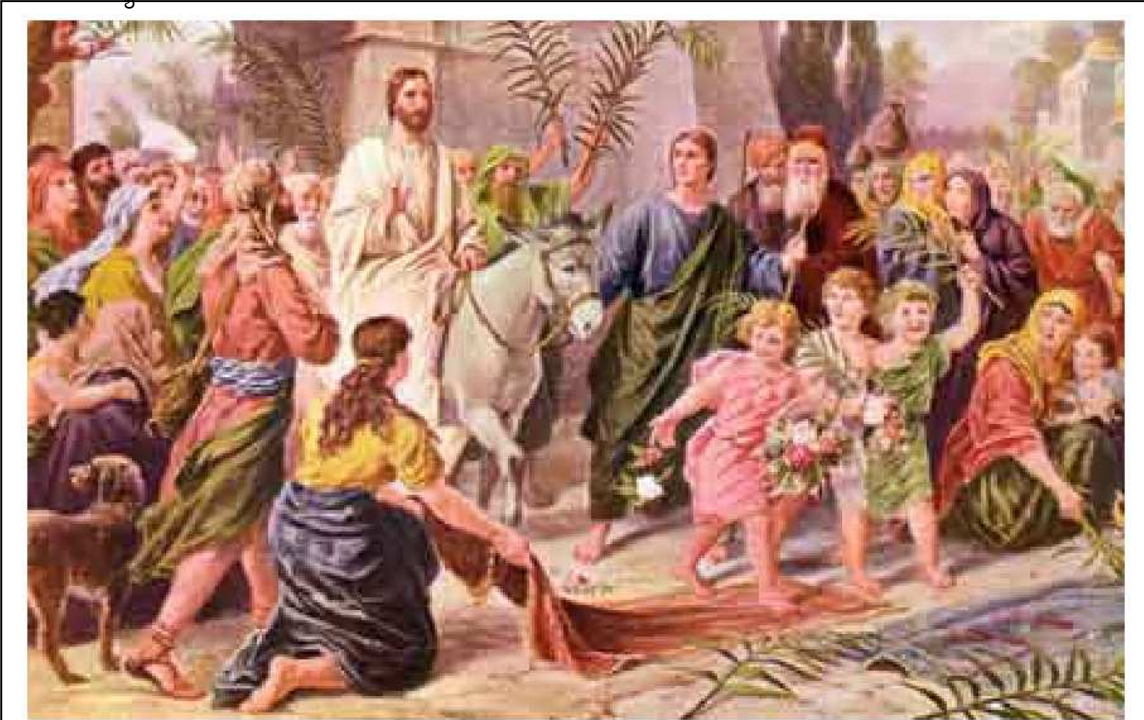
"Behold, your king comes to you,"