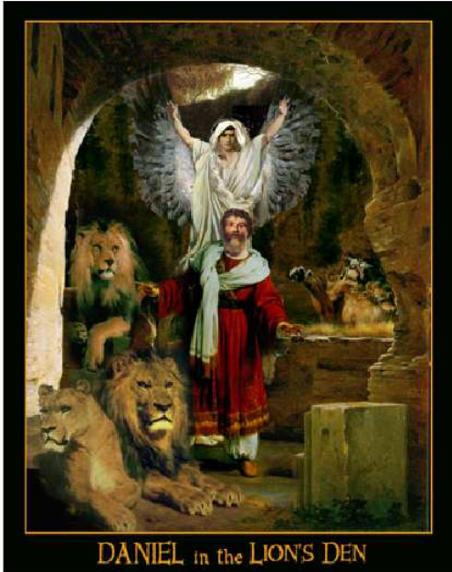
DANIEL in the LIONS DEN

"Look! I see four men walking around in the fire, unbound and unharmed, and the fourth looks like a son of the gods."